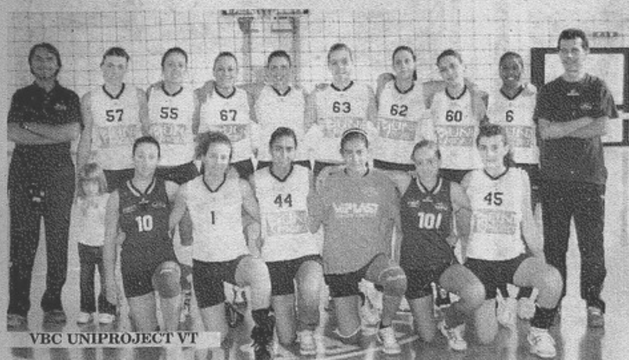
VBC UNIPROJECT VT

Cinque team di D e tre di Prima Divisione. Oggi le finali